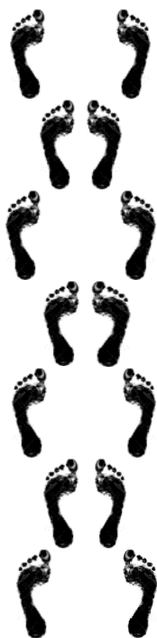
Pieds joints écartés

Consigne : sauter en fonction des indications du traçage : un pied puis l'autre, les deux pieds ensemble, cloche-pied, en marelle, en sauts à pieds joints. Dans les couloirs, ou dans la cour. A adapter selon l'âge des enfants.