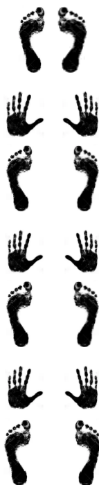
Saut de lapin